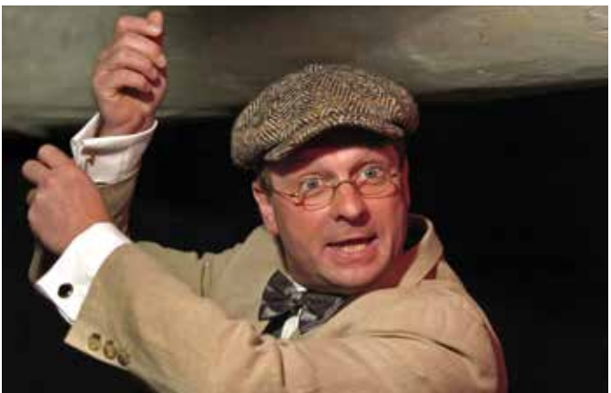
Hagen Möckel