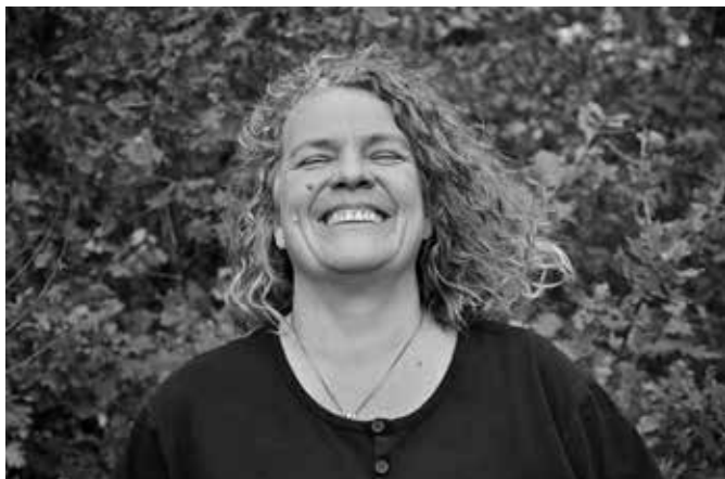
Ingeborg Freytag, Foto: I. Freytag