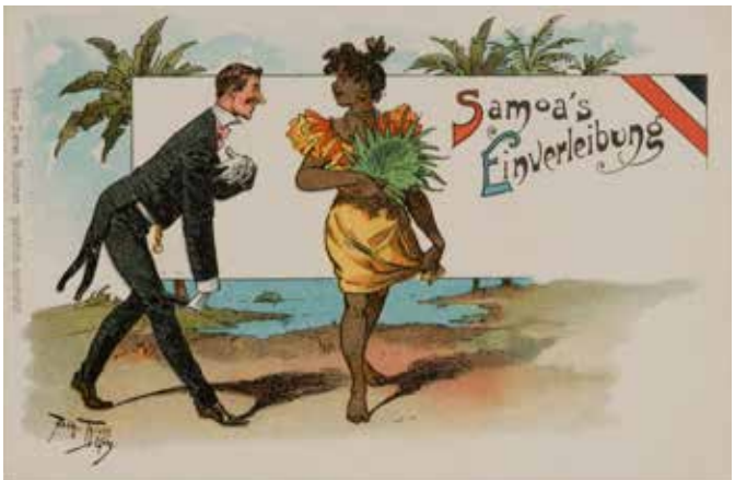
Karikatur von 1899, Ansichtskarte: Dieter Klein